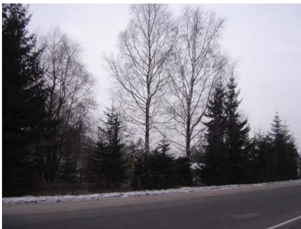
3.foto. Kokaugu rinda ar eglēm un bērziem.

Zemesgabala dabisko robežu gar apvedceļu veido dažādu kokaugu rinda. Pārsvārā kokaugi ir rindā sastādīti 20.gs. 70-80jos gados, izņemot divus bērzes, kas vistīcāmāk ir izauguši pašizsējas ceļā.