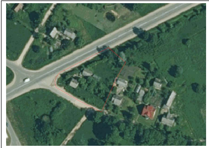
4.foto. Skats no putna lidojuma (sarkana līnija – detālpplānojuma teritorija)

Šis skujkoku dzīvžogs visticamāk ir bijis paredzēts cirtā veidā, par ko var secināt pēc rindas, kas atrodas Ganību ielas pretējā pusē, kā arī dzīvžogu rinda ir mēģināta 90tajos gados pagarināt uz Ventas upes pusi, kas iespējams sliktās kopšanas dēļ ir ļoti vājš iepriekš minēto funkciju pildītājs.