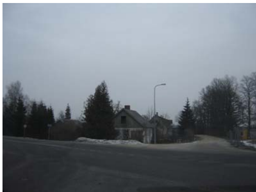
1.foto. Skats no Jelgavas ielas

Nekustamais īpašums Jelgavas iela 94 atrodas pie Kuldīgas apvedceļa un Jelgavas ielas krustojuma un līdz ar to tas ir labi pārredzams no divām lielām transporta artērijām.