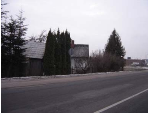
5.foto. No kreisās kolonnveida tūjas, ceriņi un konusveida tūjas