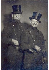
Formas tērpi Kuldīgas novada muzeja krājumā No 10.02.

Tematiskajā izstādē ir skatāmi Kuldīgas novada muzeja krājumā esošie formālie un neformālie formas tērpi vai to daļas, kā arī fotogrāfijas par šo tēmu. Izstādē tiek parādītas profesijas un jomas, kurās tikuši valkāti formas vai amata tērpi, sākot no 19. gs. beigām līdz pat mūsdienām.