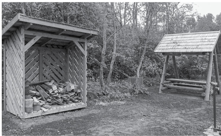
Ventas krastā pie Riežupes ietekas ierīkota jauna atpūtas vieta.

Projekts „Ūdenstūrisma kā dabas un aktīva tūrisma komponentes attīstība Latvijā un Igaunijā” jeb „Riverways” tika ieviests ar Kurzemes plānošanas reģiona vadību un 39 Latvijas un Igaunijas partneru atbalstu. Projekts tika īstenots Igaunijas – Latvijas pārrobežu sadarbības