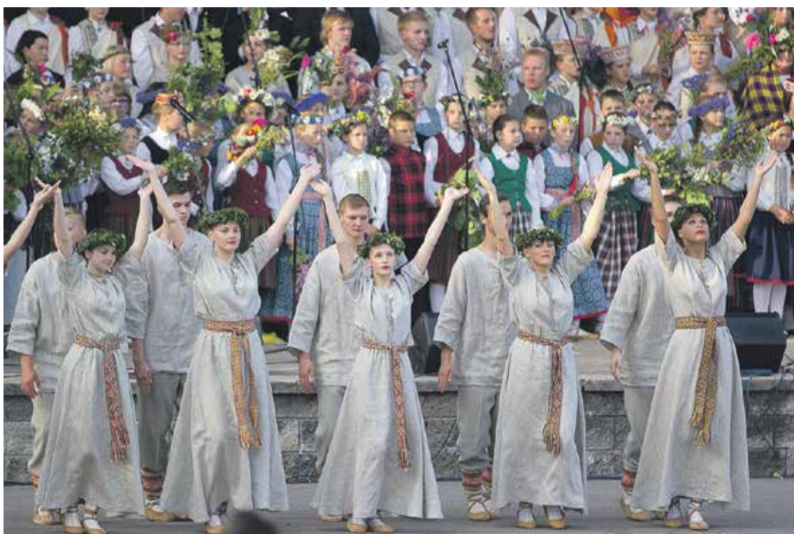
Pasākumā uzstājās Ēdoles jauniešu deju kolektīvs „Sprigulis”.

Kuldīgas ļaudis un pilsētas viesus visas dienas garumā priecēja muzikāli priekšnesumi, zāļu tirgus, izstādes un izrādes. Pilsētas dārzu piedziedāja Kuldīgas novada vokālie ansambļi, kapelas un Kuldīgas saksofonisti, kā arī sadancoja bērnu deju kolektīvs „Stariņš” un tautas deju ansamblis „Venta”. 1905. gada parku piepildīja vairākas izstādes. Savus darbus izrādīja tautas lietišķās mākslas studijas „Varavīksne” un „Ķocis”, tēlotājmākslas studija „Kuldīgas palete”, Padures aušanas pulciņš „Andava”, Kuldīgas tautastērpa darināšanas klase „Pūralāde” un Kuldīgas novada muzeja rokdarbnieču kopa „Čaupe”. Skatāmas bija arī trīs fotoizstādes –