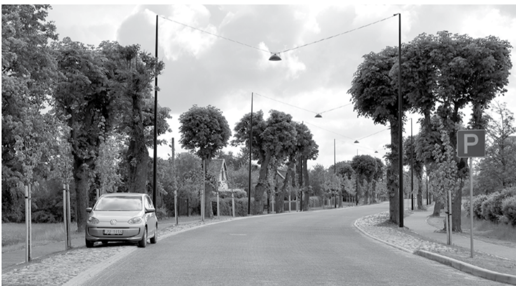
Stendes ielas abās malās ierīkotās autostāvvietas tagad aprīkotas ar ceļazīmēm.

Kuldīgā beigusies rekonstrukcija stāvlaukumā pie kafejnīcas „Pilādzītis” netālu no ievērojamākajiem apskates objektiem – senā ķieģeļu tilta un Ventas rumbas.