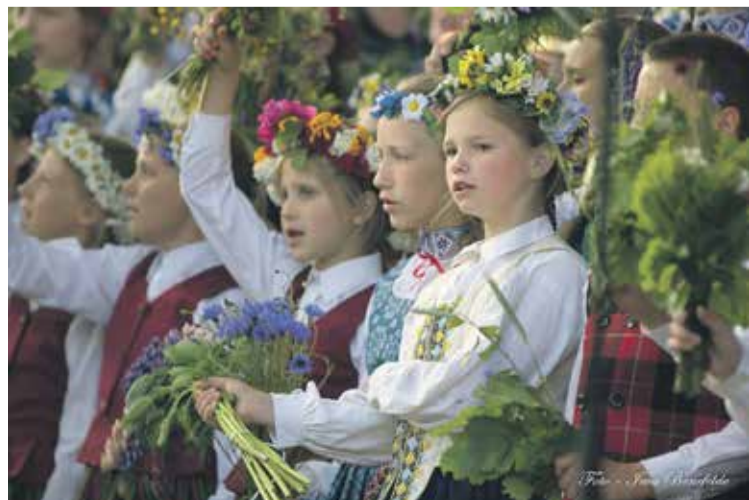
Novada bērni un jaunieši lielkoncertā klausītājus priecēja ar populāru un citām latviešu dziesmām.

SIGNETA REIMANE, sabiedrisko attiecību speciāliste