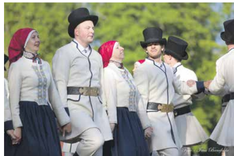
Kuldīgas vidējās paaudzes deju kolektīvs „Bandava” svētkos dejoja jaunajos Kuldīgas tautastērpos.