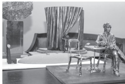
Iedzīvotāji aicināti balsot par kādu no pieciem Ē. Valtera pieminekļu konkursa variantiem.

Kā jau iepriekš ziņots, iepriekšējais metu konkurss par Ēvalda Valtera pieminekļa (vides objekta) izveidi Kuldīgā beidzās bez rezultātiem – pēc sabiedriskās apspriešanas un garām diskusijām konkursa žūrijas komisijā, kurā neviens no piedāvājumiem nesāņēja viennozīmīgu žūrijas un sabiedrības atbalstu, tika nolemts konkursu izsludināt atkārtoti.