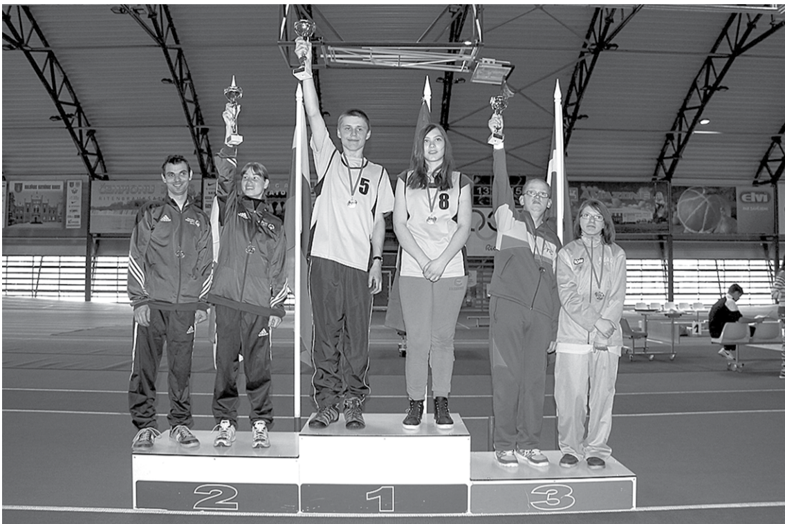
Boccia sacensību dubultspēlē 1. vietu izcīnīja komanda no Latvijas, 2. vietā atstājot igauņus, bet trešie palika lietuvieši.

No 10. līdz 12. aprīlim Kuldīgā un pirmoreiz Latvijā notika 1. atklātās Baltijas valstu starptautiskās boccia sacensības.