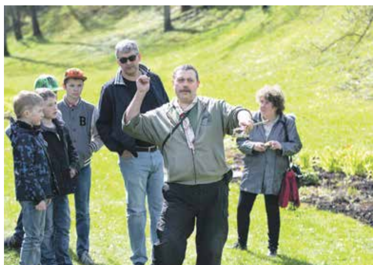
Drosmes, atjautības un veiklības pārbaudījumus lieliem un maziem piedāvāja Kuldīgas skautu sagatavotās atrakcijas.