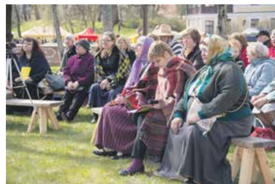
„Kūravas” skvērā klātesošos priecēja stāsti, danči un visāda citāda aizraujoša „vārīšanās”.

SIGNETA REIMANE, sabiedrisko attiecību speciāliste