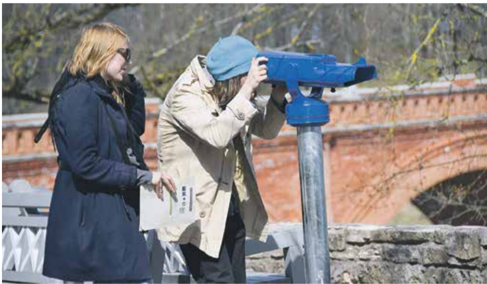
Pils ielā uzstādīts stacionārs ainavu tālskatis.

Vienā no tūristu iecienītākajām vietām – Pils ielā, iepretim restorānam „Bangerts” – ierīkots stacionārs ainavu tālskatis, kurā ikviens bez maksas var vērot vimbu lidojumu Ventas rumbā.