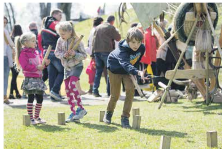
Grobīņas vikingu teltī valdīja īstena senatnes elpa ar īstenām vikingu atrakcijām un spēlēm.