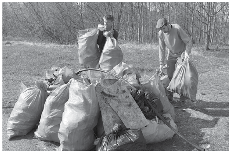
Šogad pašvaldības darbinieki sakopa Ventas kreiso krastu – teritoriju gar taciņu, kas ved uz Putnudārzu.

Katrā pagastā bija izvēlētas vairākas talkas vietas. Rumbas pagastā tika sakopta pastaigu taka Riežupes dabas parkā, atbrīvojot to no kokiem un dažāda veida atkritumiem, kā arī saī-