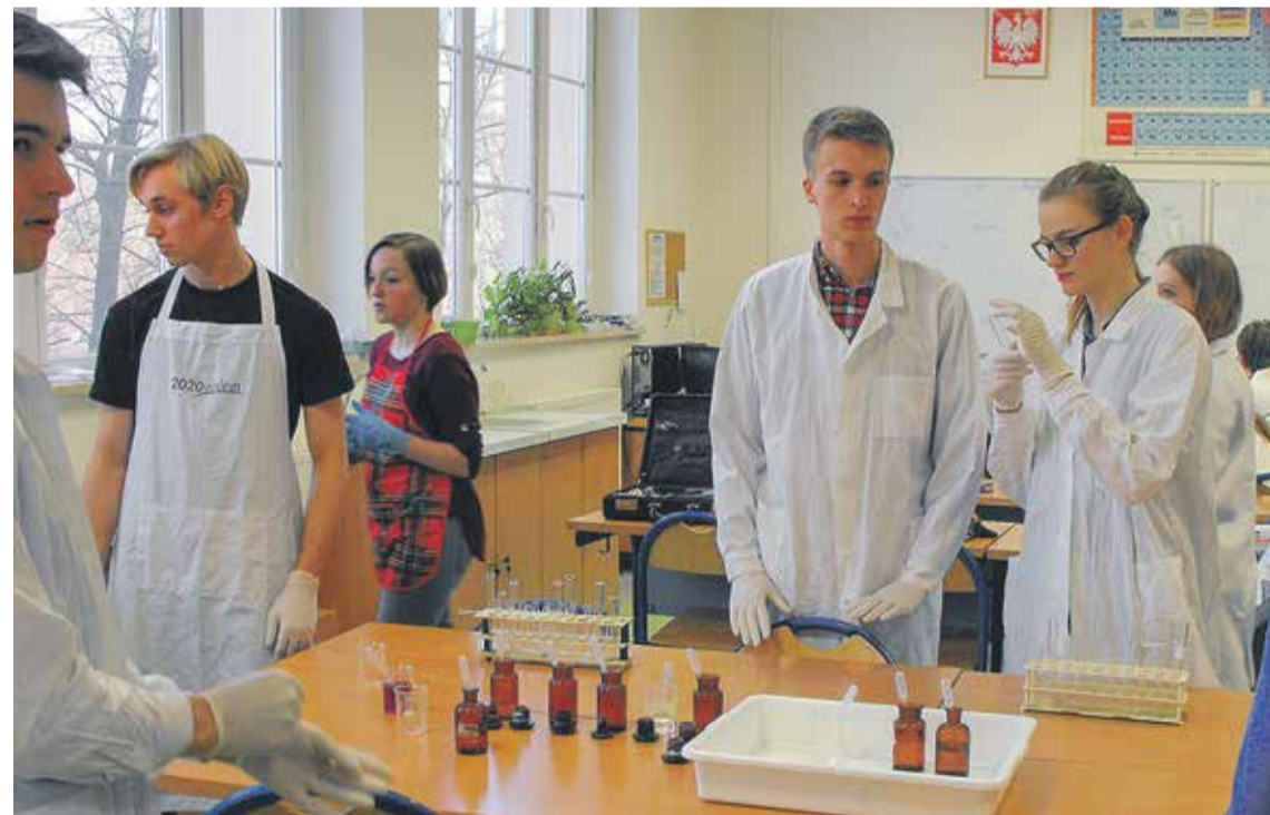
Varšavas 125. skolas skolēni praktiski darbojas ķīmijas laboratorijā.

Jaunu pieredzi un pozitīvu iespaidu Kuldīgas novada pedagogi ieguva Kopernika zinātnes centrā, kurā bija iespēja gūt lieliskas idejas darbā ar skolēniem ne tikai mācību stundās, bet arī ārpusstundu nodarbībās. Dienas noslēgumā pedagogi apmeklēja planetāriju izrādi „Kopernika debesis”, un, pateicoties jaunākajām tehnoloģijām, jutās kā