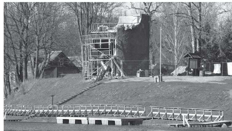
Mārtiņsalas glābšanas stacijā notiek rekonstrukcija, ko plānots pabeigt maija beigās.

Projekta „Glābšanas stacijas rekonstrukcija, Mārtiņsalā, Sten-