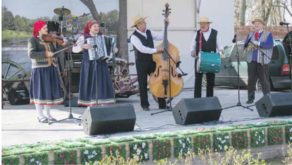
Pavasari iespēja un ļaudis priecēja kapela „Paurupīte”.

Pilsētas dārzu piedejoja, iespēja un piedziedāja lieli un mazi, tuvu un tālu braukuši mākslinieki. Zinātkārie visas dienas garumā Ventas rumbā klausījās unikālos stāstus