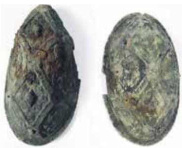
Veckuldīgas pilskalnā atrastās 9. – 10. gs. bruņurupuču saktas.

Pagaidām konstatēti divi uguns-kapi – kā vikings, tā kurši mēdza savus mirušos sadedzināt, sārtam atdotot arī ieročus, rotas un, viņuprāt,