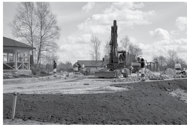
Tiek atjaunots Stendes ielas stāvlaukums.

tājiem un viesiem par sagādātajām neērtībām. Kuldīgas novada pašvaldība automašīnu novietošanai aicina izmantot stāvvietas Krasta ielā.