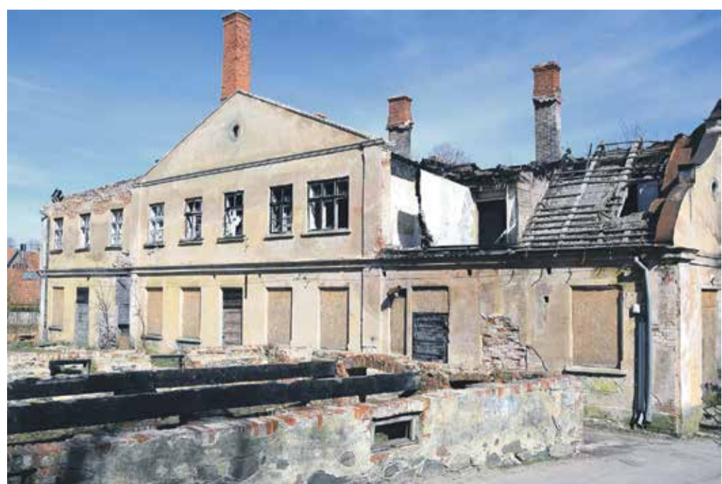
Skolas ielas 2 ēkas īpašniekiem uzdots steidzami sākt glābšanas darbus, jo būve ir bīstama cilvēkiem.

2013. gada 19. decembrī tika pieņemts lēmums uzdot SIA „Project Development Investments” Būvniecības nodaļā izņemt plānošanas un arhitektūras uzdevumu. Līdz 2014. gada 1. februārim ēkas īpašniekam bija jāiesniedz konkrēts risinājums ēkas jumtam, savukārt līdz 1. novembrim bija jābūt uzklātam pagaidu jumtam. Līdz pērnā gada 1. jūlijam uzņēmumam Kuldīgas novada Domes Būvniecības komisijā bija jāiesniedz saskaņots skieču projekts, bet līdz 1. novembrim – saskaņots tehniskais projekts. Šī gada 27. februārī būvinspektori Skolas ielas 2 ēkā nav konstatējuši nekādas īpašnieka darbības, lai uzlabotu grausta tehnisko stāvokli. Īpašnieks nav sniedzis rakstisku atbildi un paskaidrojumus uz Kuldīgas novada Domes nosūtīto dokumentāciju un vēstulēm, kā arī nav iesniegts ēkas skieču un tehniskais projekts, kas liecinātu par īpašnieka interesi objekta sakārtošanā. Ungungrēks Skolas ielā 2 izcēlās