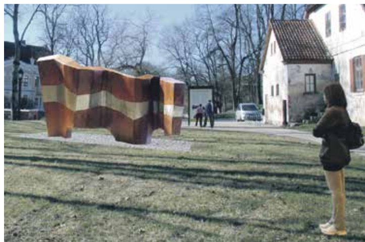
Latvijas karogs Ventas upes līkumu formā leguva vislielākās iedzīvotāju simpātijas balsojumā interneta vidē.

KRISTĪNE DUĻBINSKA, Mārketinga un sabiedrisko attiecību nodaļas vadītāja