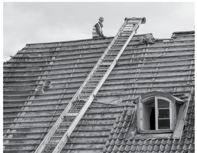
Īpaša uzmanība seminārā tiks pievērsta dakstiņu jumtu atjaunošanai, pārrunājot tipiskākās kļūdas un labo praksi.

24. aprīlī 12.00 Kuldīgas novada Domes mazajā zālē dažādu jomu amatnieki un būvnieki tiek aicināti apmeklēt izglītojošu semināru „Tipiskākās kļūdas vēsturisko ēku atjaunošanas procesā”.