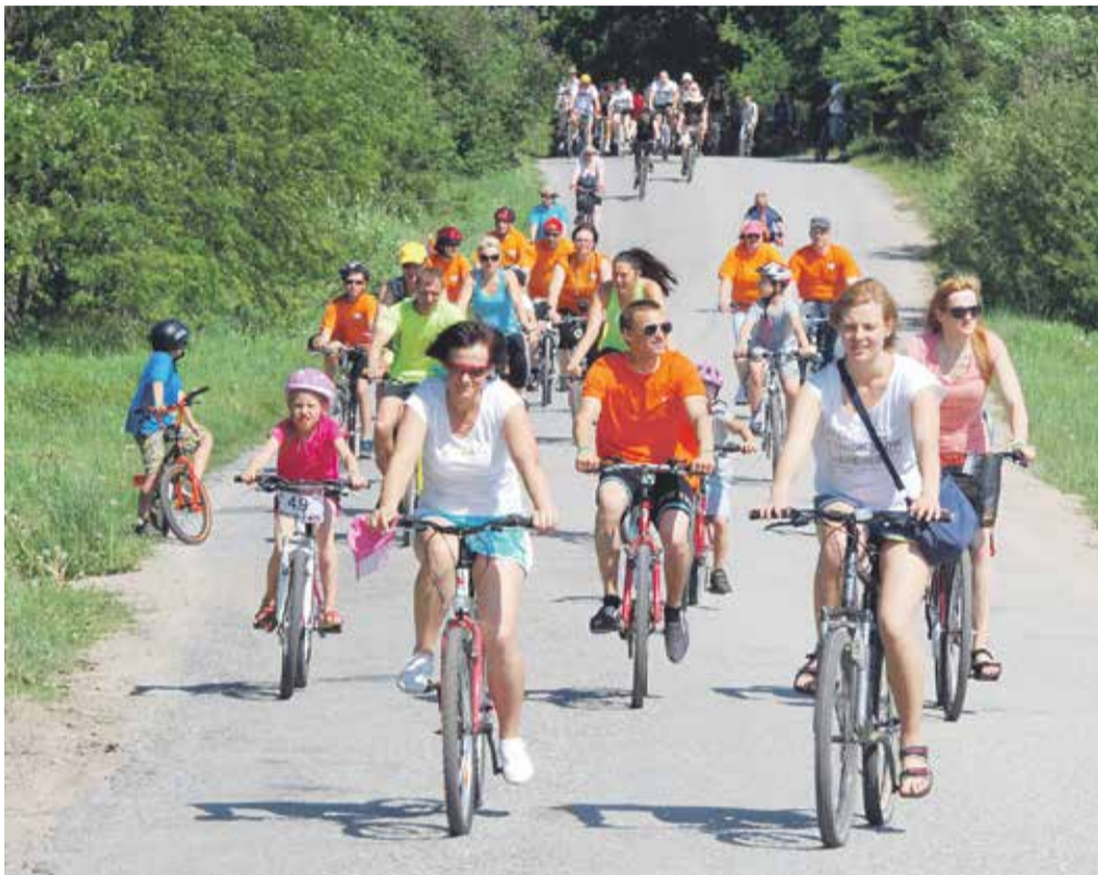
Velodiena Kuldīgā, kas kļuvusi par vērienīgu pasākumu Latvijā, šogad notiks jau 8. gadu.