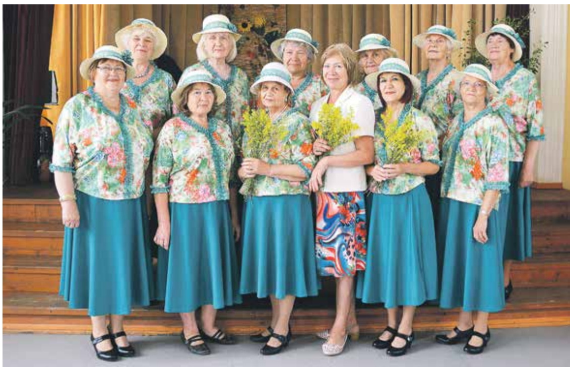
Pensionāru apvienības „Rumbiņa” deju kopas dāmas tikušas pie jauniem skatuves tērpiem un apaviem.

Kuldīgas pilsētas pensionāru apvienība „Rumbiņa” piedalījās izsludinātajā Ziedot.lv sociālās jomas projektu konkursā un saņēma finansējumu projekta „Eiro deju kopa jaunos tērpos!” īstenošanai.