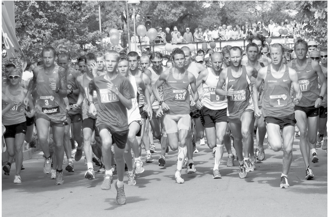
10. Kuldīgas pusmaratona trase vīsies pa pilsētu, bet starts un finišs būs pilsētas estrādē.