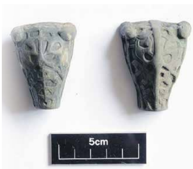
Sieviešu lāčgalvu saktas.

SIGNETA REIMANE, sabiedrisko attiecību speciāliste