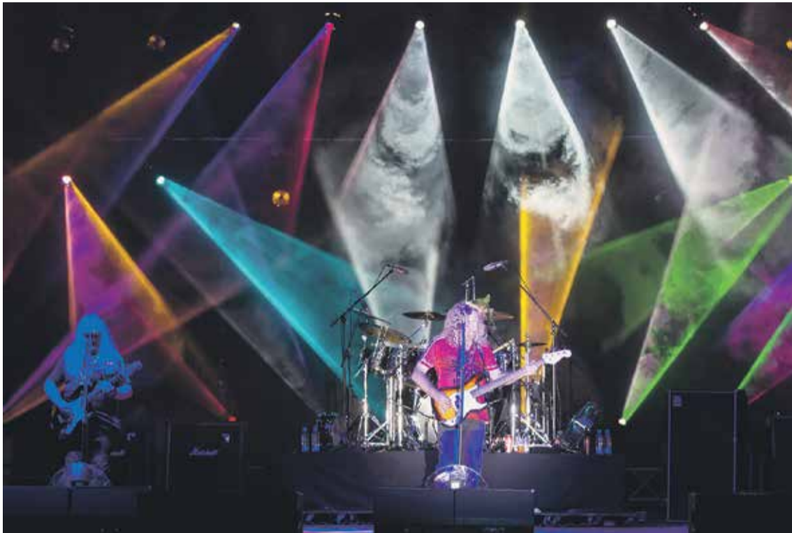
Grupu „Sweet” pirmajā dienā klausītāji gaidīja visdeģsmīgāk, un mākslinieki savu uzstāšanos aizvadīja godam.

Lielākā daļa publikas bija vidējā paaudze, kuras laikos šo mūziku brīvi klausīties nevarēja, kur nu vēl doties uz koncertiem. Ne viens vien klausītājs atzina, ka gaida festivālu,