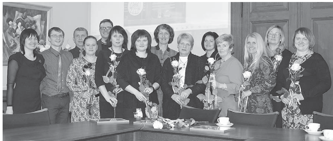
Janvāra vidū Kuldīgas novada Dome sveica skaistāko un radošāko Ziemassvētku dekoru autorus.

Kuldīgas novada pašvaldība noteikusi konkursa „Ziemassvētki Kuldīgas novadā 2013” uzvarētājus.