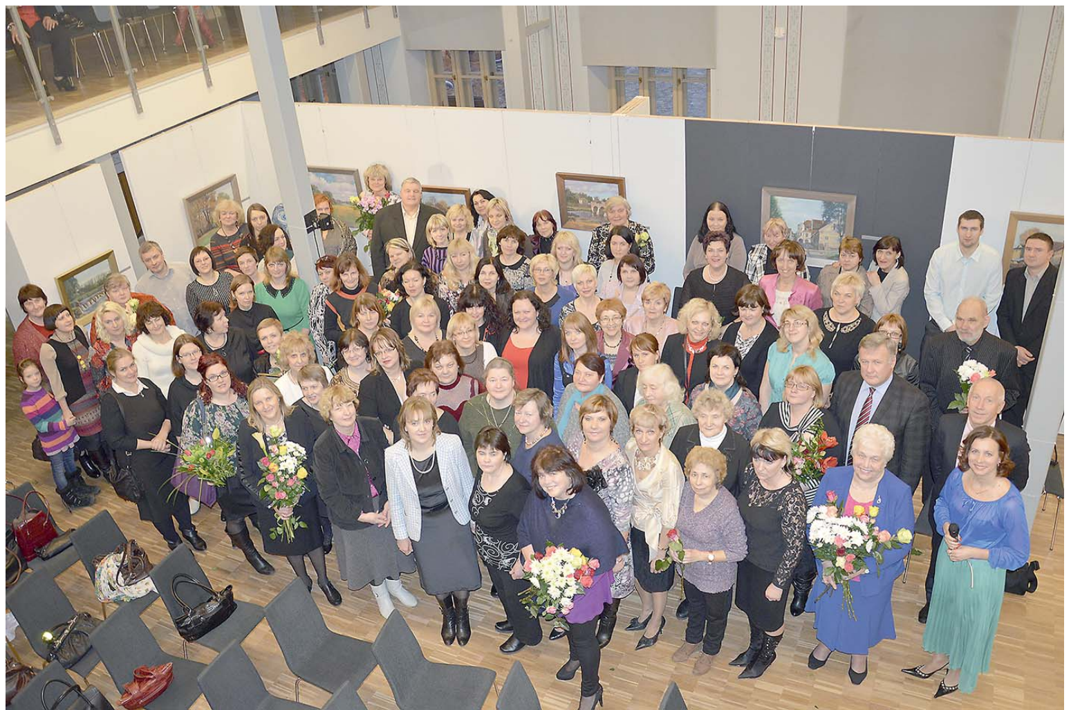
Izvērtējot paveikto 2013. gadā, tika godināti Kuldīgas novada kultūras cilvēki, pasniedzot pateicības rakstus 22 nominācijās.

Lai smeltos iedvesmu jaunam darba cēlienam, 10. janvāra pēcpusdienā Mākslas namā tika godināti novada kultūras cilvēki par paveikto 2013. gadā.