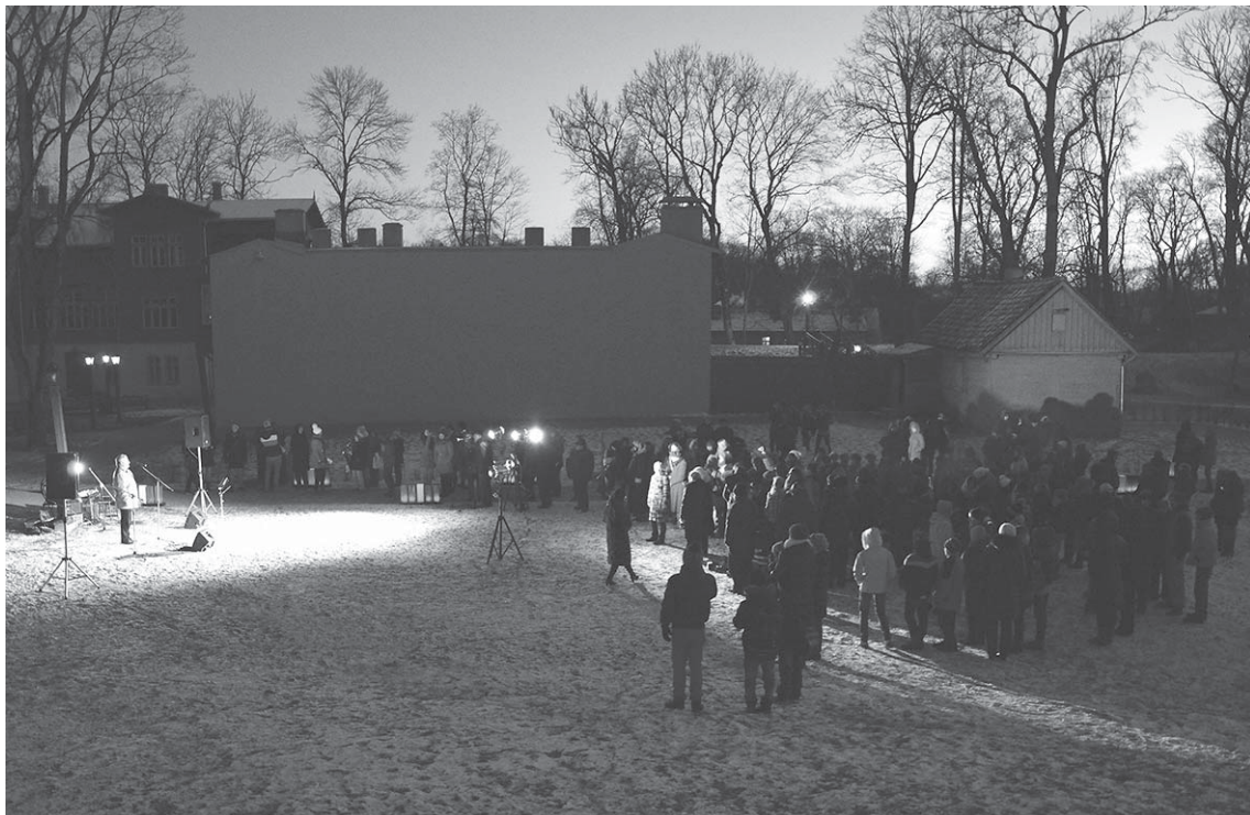
Barikāžu dienas atceres pasākums pulcēja dažāda gadagājuma interesentus.

Šogad aprit 23 gadi kopš notikumiem, kas mainīja Latvijas vēsturi, tāpēc 20. janvārī Pilsētas dārzā iedzīvotāji pulcējās pie ugunsкура, lai pieminētu Barikāžu dienas.