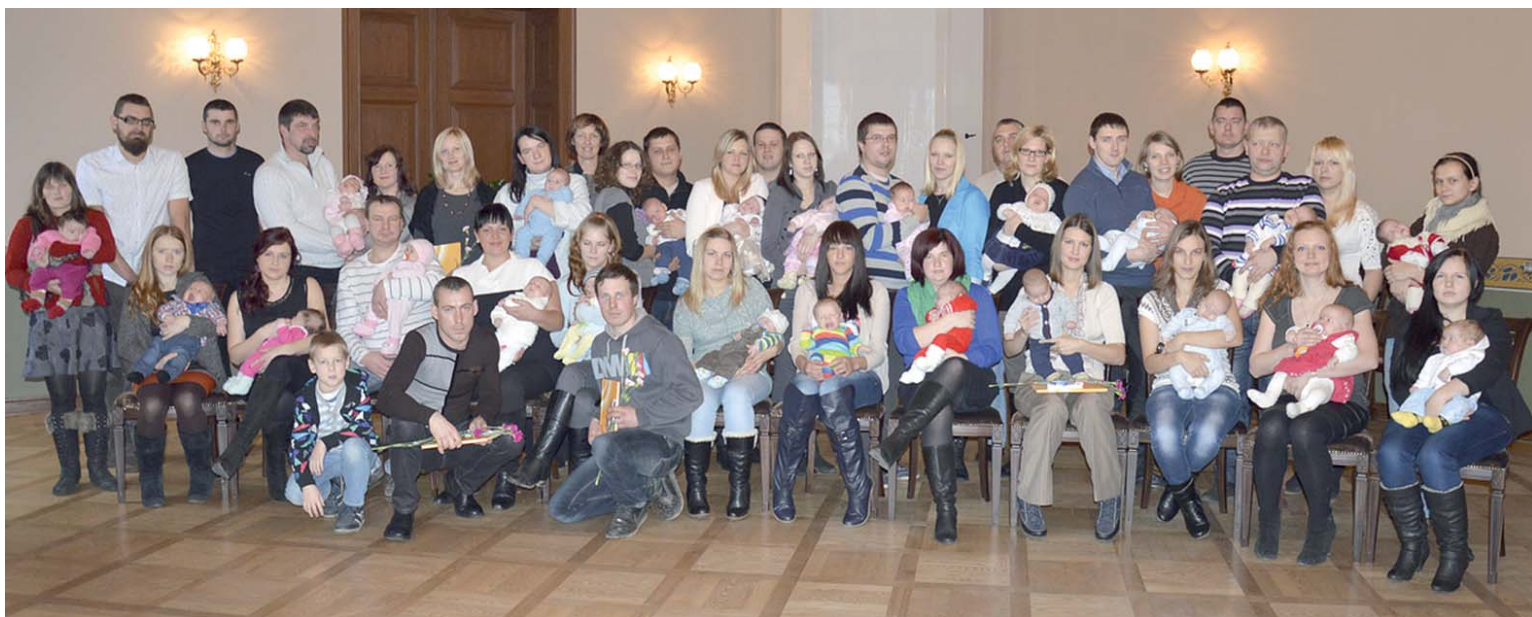
2013. gada novembrī un decembrī dzimušie mazuļi viesojās Kuldīgas novada Domē, lai saņemtu sudraba karotīti.

Salīdzinot iepriekšējos gadus, priecājamies, ka 2013. gadā ir vairāk bērniņu nekā 2012. gadā. Pērn reģistrēti 233 bērniņi – 116 zēni un 117 meitenes. 100 ģimenēs mazulis bijis pirmais bērns, 84 ģimenēs – otrais, 32 ģimenēs – trešais, 11 ģi-