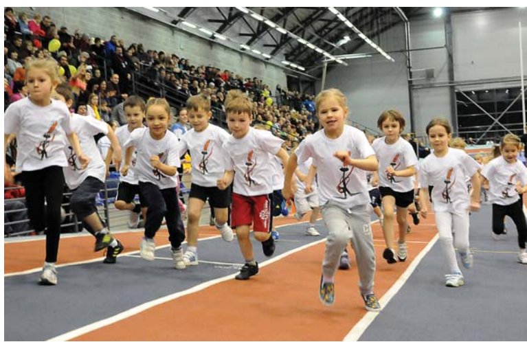
Elites sportistu startus tradicionāli ievadīja bērnu skrējienā, veicot goda apli.