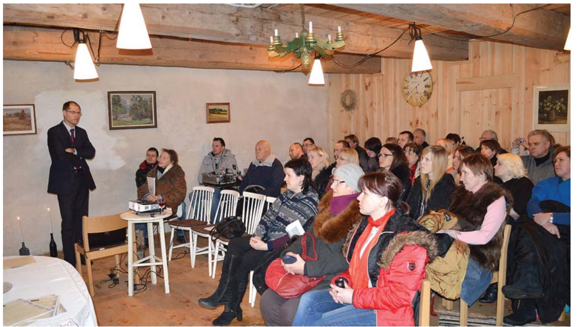
Uz Tūrisma gada saietu Padures muižas klētī pulcējušies daudz interesentu.

Veiksmīgam tūrisma uzņēmumam ir jāsadarbjas arī ar izplatīšanas kanāliem un klientu piegādātājiem, piemēram, ar booking.com un citiem. „Apartaments Goldingen” Kuldīgā, iesaistoties šajā s-