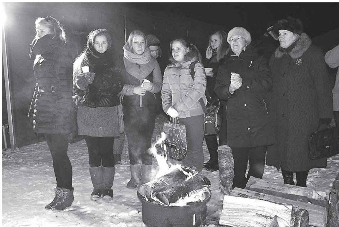
Barikāžu dienu atceres ugunskuri Pilsētas dārzā bija pulcējuši dažādu paaudžu interesentus.

21. janvārī Pilsētas dārzā pie Kuldīgas novada muzeja iedzīvotāji pulcējās pie ugunskuriem, lai pieminētu barikāžu dienas.