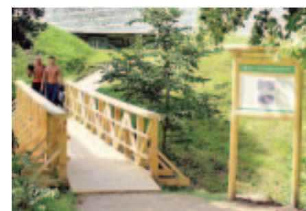
KULDĪGA SAŅEM ĀBOLA BALVU – 2.LPP.