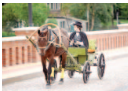
GADA NOTIKUMU APSKATS – 4. UN 5.LPP.