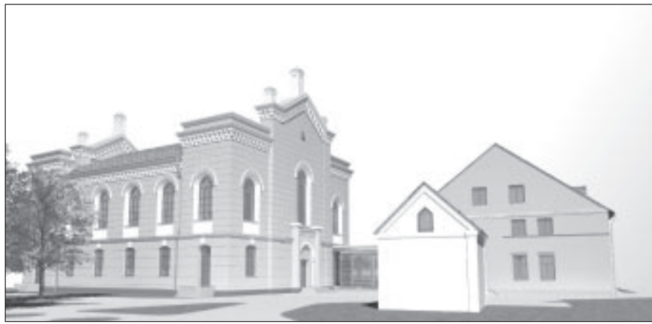
“Ozola un Bula, arhitektu birojs” projekta priekšlikuma vizualizācija. Jaunais būvprojoms ļaus saglabāt ēku vēsturisko struktūru.

Plānotais projekta īstenošanas laiks ir 21 mēnesis no 2009.gada aprīļa līdz 2010.gada decembrim. Projekta kopējās attiecināmās izmaksas ir 1 538 062,22 latī, no tām ERAF finansējums 1 307 352,89 latī, valsts budžeta dotācija –115 354,67 latī un Domes līdzfinansējums – 115 354,67 latī.