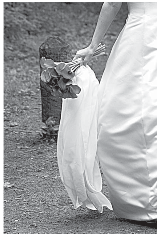
Īpašajā datumā – 10.10.10. – Kuldīgā dzīvi laulības saitēm savienos pieci pāri.

Tā saucamajās „Maģiskajās kāzās „Molā””, kas notiks 10.10.10. un par ko presē un televīzijā tiek runāts jau kopš gada sākuma, piedalīsies arī mūsu novada pāris, bet tas jau ir cits stāsts, ko viņi izstāstīs paši pēc īpašā notikuma viņu mūžā.