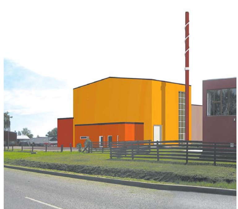
Vizualizācija. Uzbūvējot šo katlumāju, Kuldīgas pilsētā tiks nodrošināta iztrūkstošā siltumenerģijas ražošanas jauda aukstākajos ziemas mēnešos, kā arī būs rezerves, lai apkalpotu un nodrošinātu ar siltumenerģiju jaunus pieslēgumus.

Biomases koģenerācijas projektēšanas darbi uzsākti 1. oktobrī.