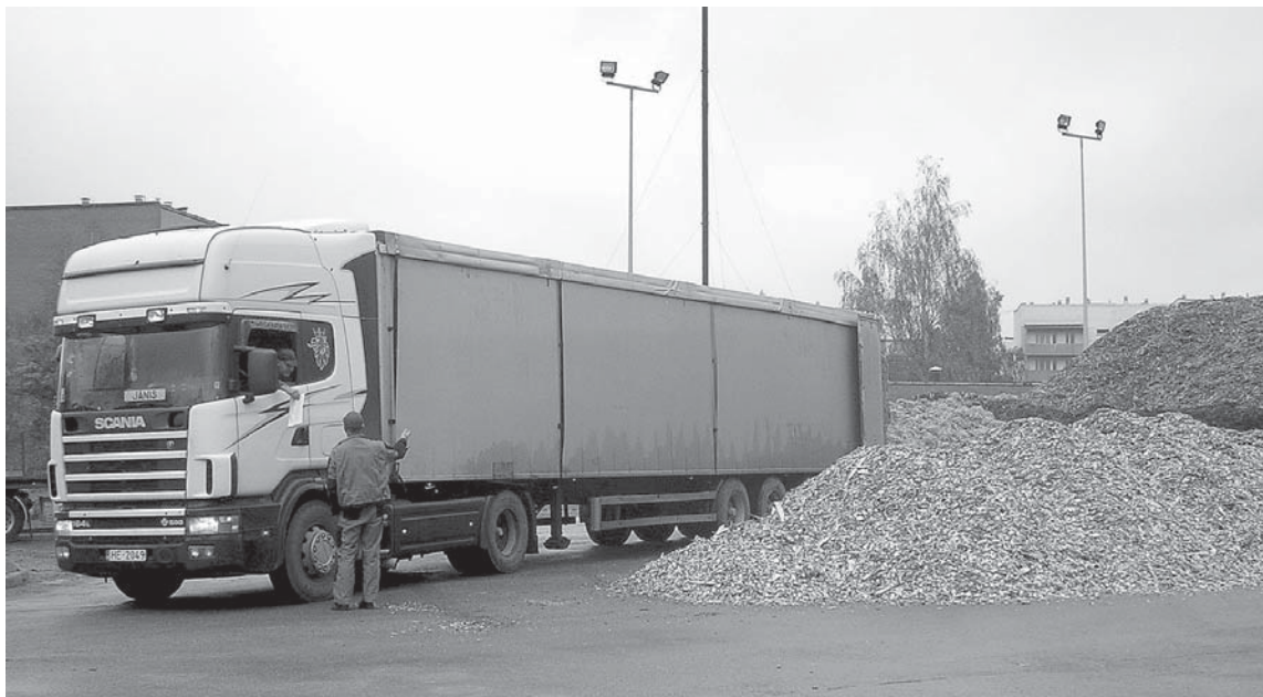
Lai varētu iepirkt pietiekamā daudzumā kurināmo ziemai, SIA „Kuldīgas siltumtīkli” aicina iedzīvotājus, kuri ir parādā par siltumu, steidzami ierasties uzņēmumā un sastādīt individuālo parādu nomaksas grafiku.

Viens šķeldas berkubs maksā ~ Ls 6,50. Pagājušajā sezonā cena bija no ~ Ls 5,70 līdz Ls 6. Lai arī šķeldai paaugstinājusies iepirkuma cena, uzņēmums neplāno izmaiņas