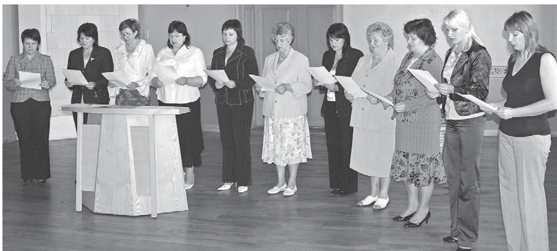
Zvērestu nodod Kuldīgas novada pagastu bāriņtiesu locekļi.

Kuldīgas novada pagastu un pilsētas bāriņtiesu priekšsēdētāji un locekļi 10. septembrī Kuldīgas novada Domē svinīgi nodeva zvērestu, solot būt uzticīgi Latvijas valstij, godprātīgi un pēc labākās apziņas un pārliecības pildīt valsts likumus.