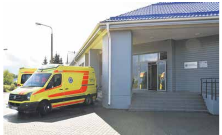
Rekonstrukcijas rezultātā tapusi moderna un ērta Neatliekamās medicīniskās palīdzības dienesta Kurzemes reģionālā centra ēka un iegādātas divas jaunas operatīvās automašīnas.

nālais centrs nodrošina neatliekamo medicīnisko palīdzību vairāk nekā 262 tūkstošiem iedzīvotāju. Reģionā katru diennakti dežurē 25 mediķu brigādes 15 vietās Kurzēmē. 2013. gadā NMP brigādes devušās