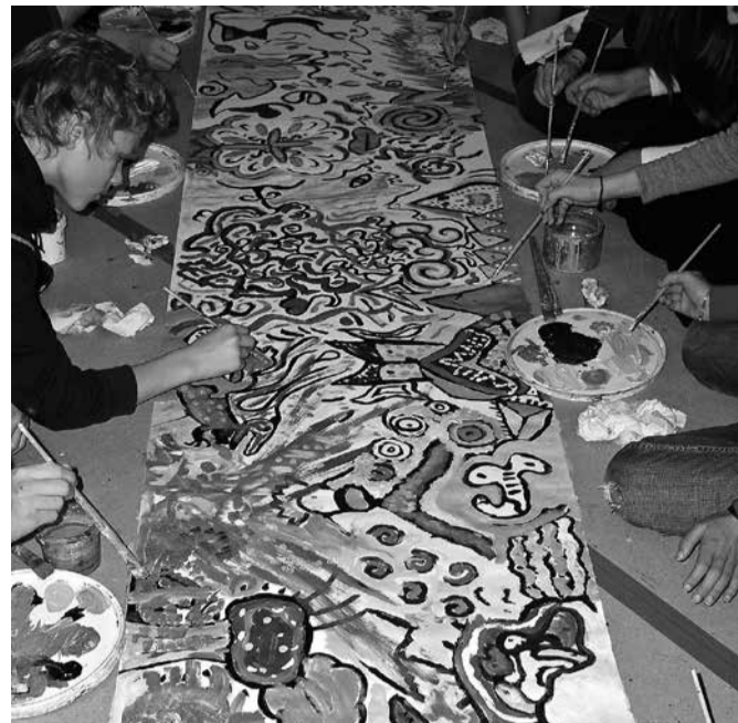
Mākslas nams ik sestdienu aicina ģimenes ar bērniem uz jaunu mākslas nodarbību ciklu, kuru vadīs profesionāli mākslinieki.

IEVAS VĪTOLAS-LINDKVISTAS, Mākslas nama vadītājas teksts un foto