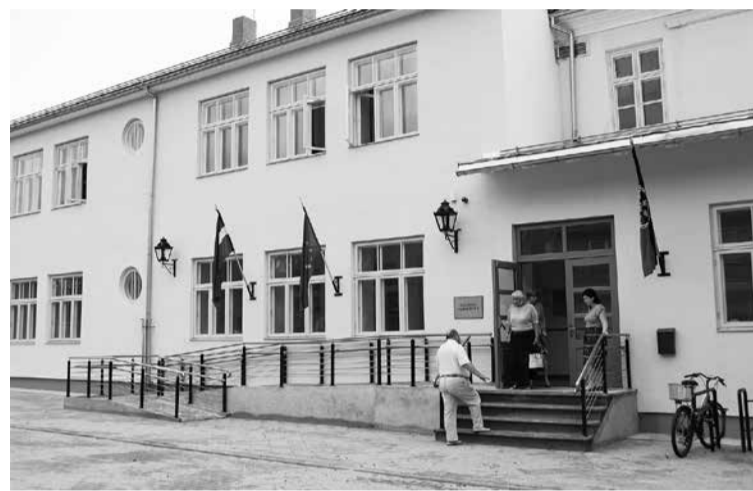
Kuldīgas pamatskolas audzēkņi jauno mācību gadu varēs sagaidīt atjaunotās un uzlabotās telpās.

SIGNETA REIMANE, sabiedrisko attiecību speciāliste