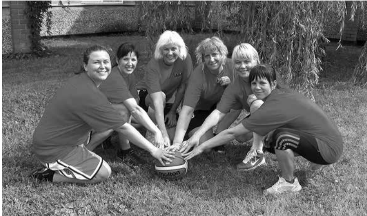
Kuldīgas sievietes komanda strītbolā izcīnīja 1. vietu.

SIGNETA REIMANE, sabiedrisko attiecību speciāliste