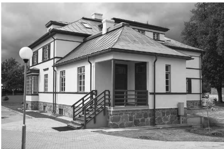
Pēc pirmsskolas izglītības iestādes „Ābelīte” vecās ēkas rekonstrukcijas tiks nodrošinātas papildu 90 vietas pirmsskolas bērniem.

Pagājušā gada 4. jūnijā tika rakstfīta vienošanās starp Kuldīgas novada pašvaldību un Valsts reģionālās attīstības aģentūru par Eiropas Savienības projekta īstenošanu un finansējuma piešķiršanu projektam „PII „Ābelīte” būvniecības 3. kārtā” (nr. 3DP/3.1.4.3.0/13/IPIA/VRAA/011) aktivitātē „Pirmsskolas izglītības iestāžu infrastruktūras attīstība nacionālās un reģionālās