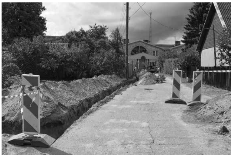
Nomaies ielā gājēju drošībai būs jauns ielas apgaismojums.

Ēdoles un Nomaies ielā šobrīd norisinās arī būvdarbi, kas saistīti ar ielas apgaismojumu. Līdz šā