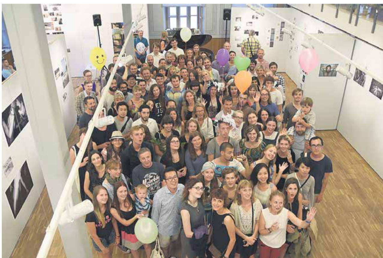
Starptautiskās fotogrāfijas vasaras skolas dalībnieki un pasniedzēji.

KINTIJA VICINSKA, Kuldīgas Mākslas nama administratore