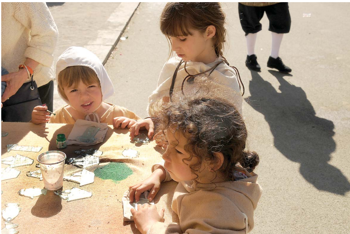
Viduslaikiem atbilstoši tērtie bērni apglezno dažādas stikla figūrīņas.