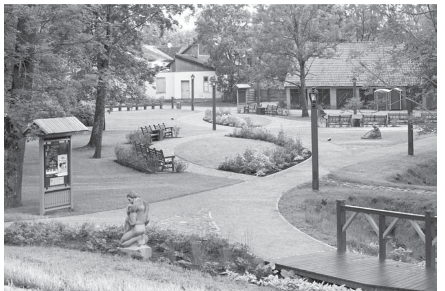
Rīgas Pedagoģijas un izglītības vadības akadēmijas Kuldīgas filiāles pagalmā radīts mājīgs un jauks skvērs.