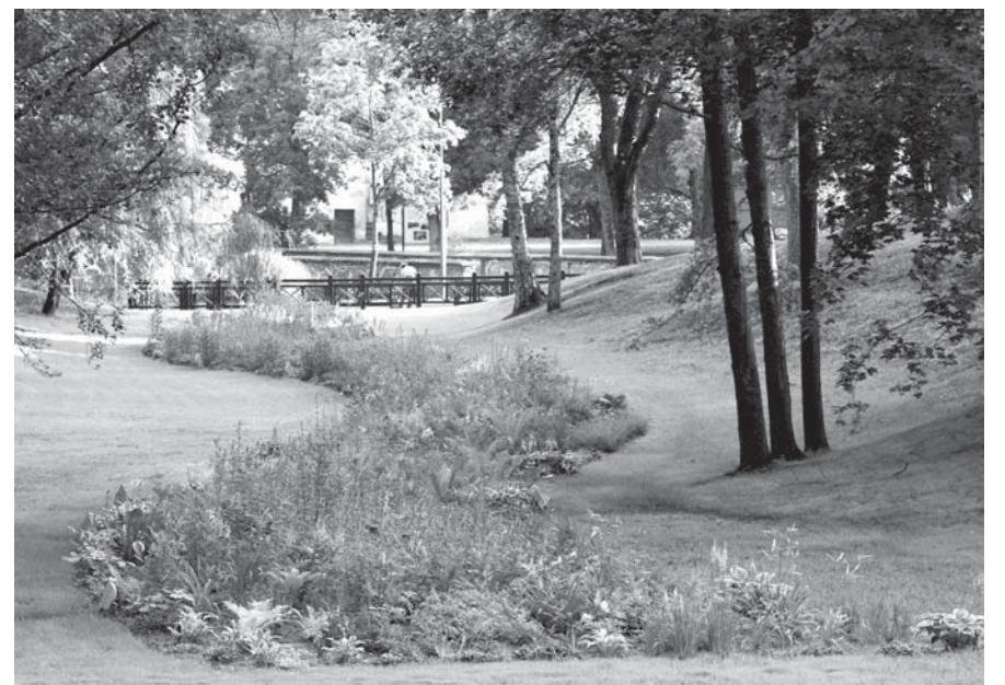
Vienu no pakalniem rotā jauna lapene.