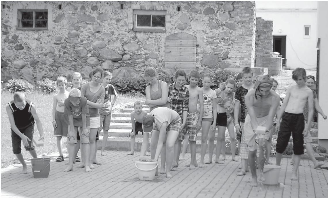
Bērni piedalās Olimpiskās dienas stafetē. Ar sūkli no spaiņa uz tālāk nolikto 3 litru burku tiek pārnesti ūdens, lai burka būtu pilna un no tās izkristu tur ieliktais plastmasas korķis.

Ar vērienīgu pasākumu 7. jūnijā noslēdzās vasaras nometne „Raibās dienas Kabilē” Kuldīgas novada Jauno talantu skolas dalībniekiem.