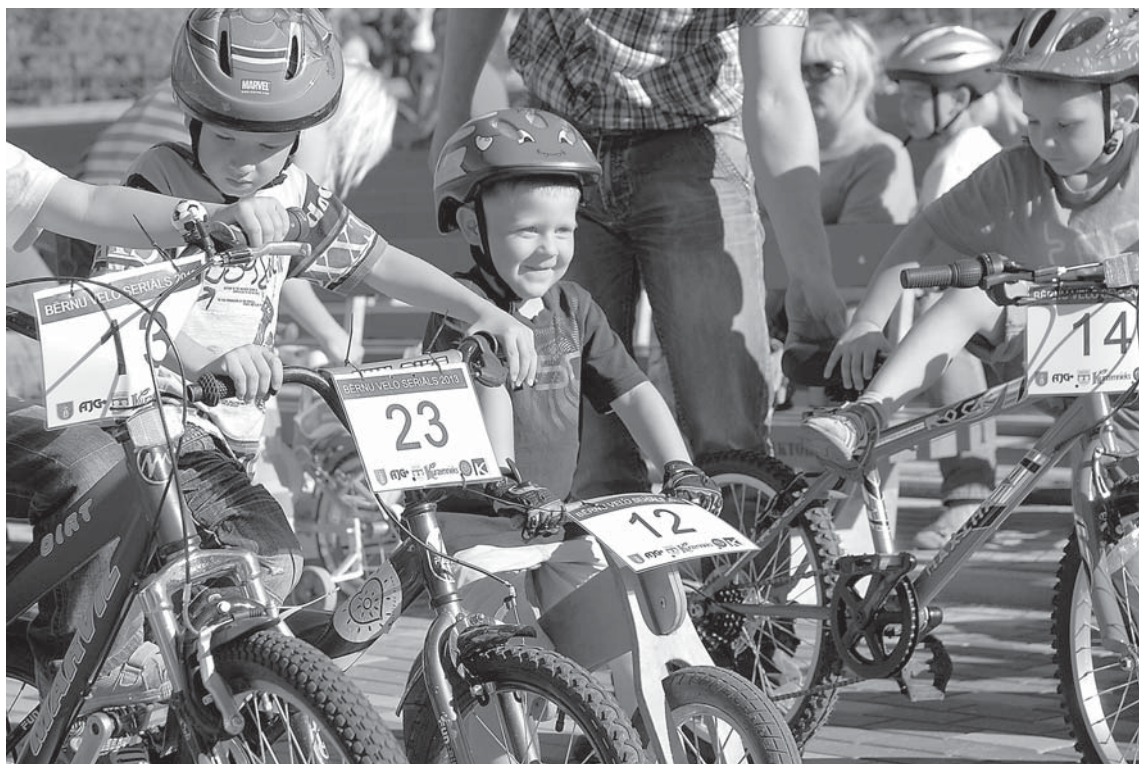
Uz starta 5 un 6 gadus veci zēni, lai dotos sprinta braucienā, kas bija 400 m jeb 2 apli.