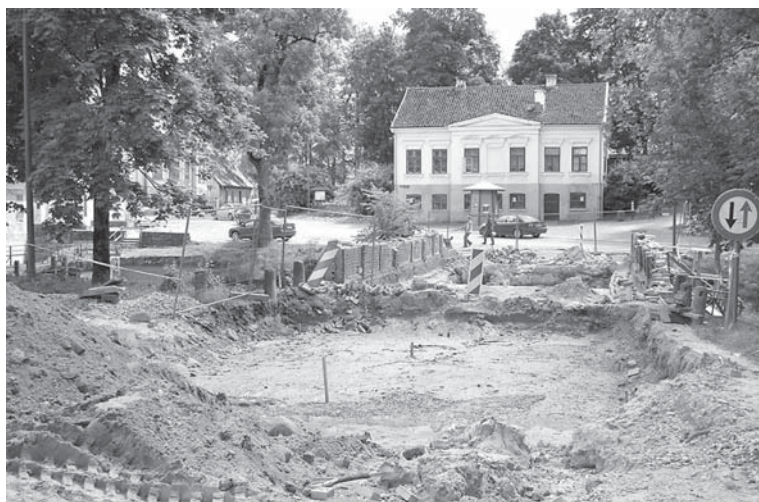
Projekta ietvaros šobrīd rekonstruē Baznīcas ielas mūra tiltiņu pāri Alekšupītei.

Aktīvi notiek darbi projekta „Kuldīgas „Venēcija” – Alekšupītes un ar to saistīto ielu un laukumu kā pievilcīgas dzīves telpas un ekonomiskās attīstības teritorijas izveide” 1. kārtā.