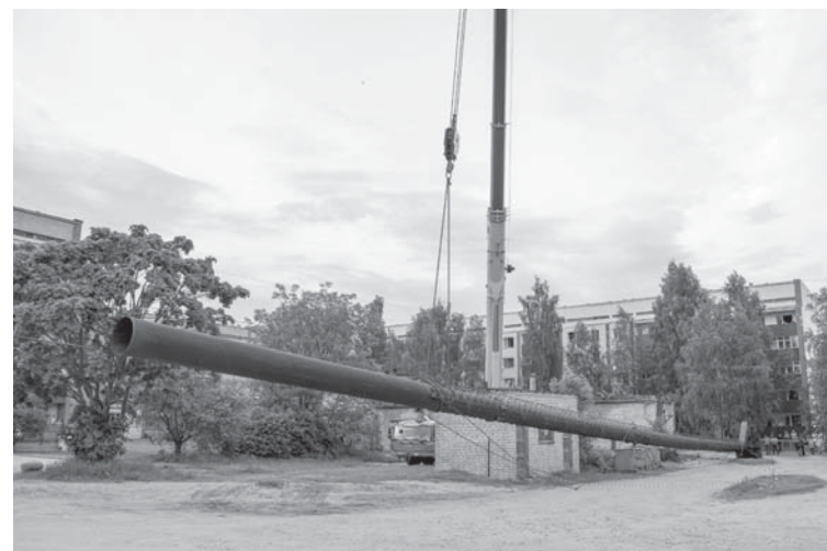
Veiksmīgi demontēts Parka ielas vecās katlumājas skurstenis.