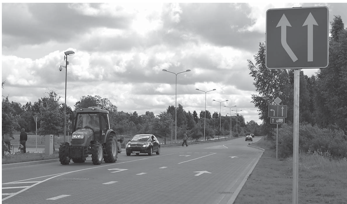
Sūru iela pēc rekonstrukcijas ieguvusi bruģi, veloceliņu un apzaļumotas apmales.

Kuldīgā par vienu sakārtotu ielu kļuvis vairāk – šomēnes ekspluatācijā tiek nodota atjaunotā Sūru iela.