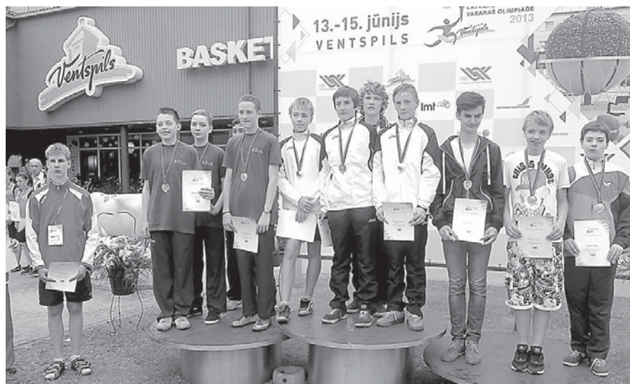
Uz apbalvošanas augstākā pjedestāla Kuldīgas novada galda tenisa komanda.