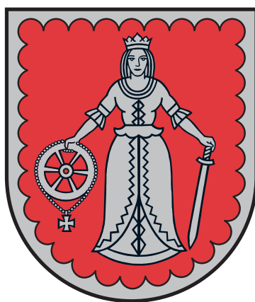
Kuldīgas novada ģerbonis