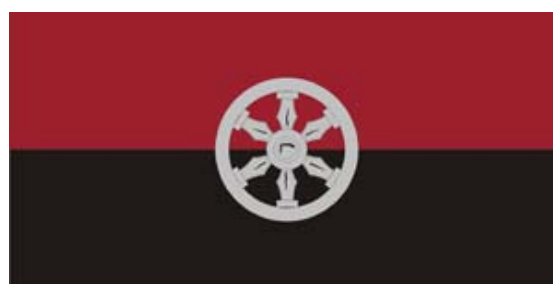
Kuldīgas pilsētas karogs