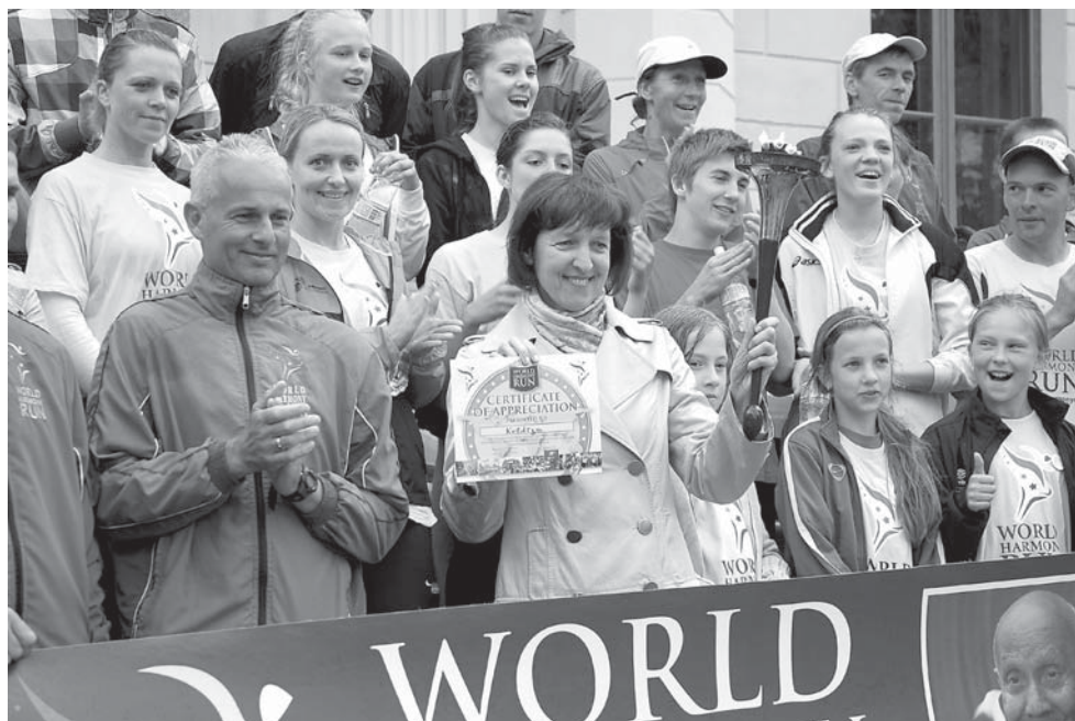
Miera skrējiena sportistu sagaidīšana Kuldīgā pie rātsnama notika 29. maijā.

Pasaules sadraudzības skrējiena Latvijas posma koordinatore komanda vēstulē pašvaldībai izsaka visdziļāko pateicību par Kuldīgas novada Domes un Kuldīgas novada sporta skolas sniegto atbalstu šī gada Pasaules sadraudzības jubilejas skrējiena Latvijas posmā.