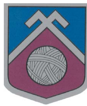
Snēpeles pagasta ģerbonis