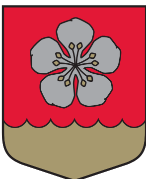
Kurmāles pagasta ģerbonis