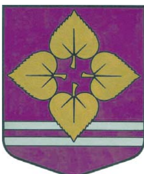
Laidu pagasta ģerbonis