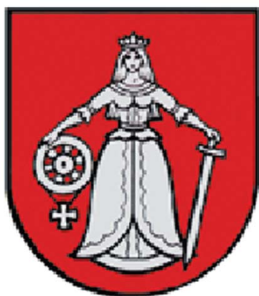
Kuldīgas pilsētas ģerbonis