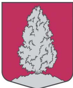
Gudenieku pagasta ģerbonis