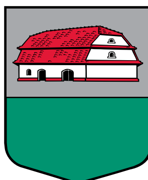
Padures pagasta ģerbonis