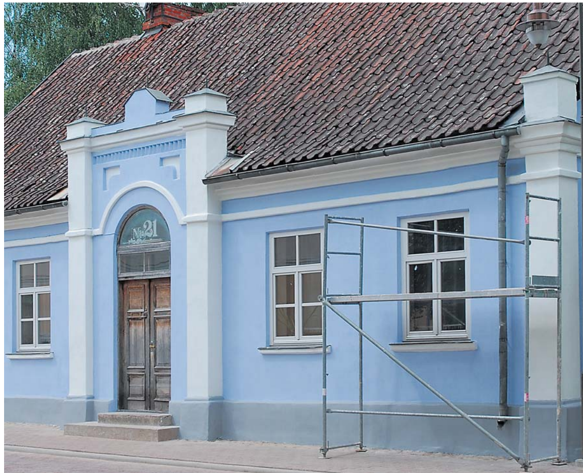
Atjaunotā fasāde Smilšu ielas 21. namam piesaista skatienus un priecē gan saimniekus, gan kuldīdzniekus un viesus.

Pilsētbūvniecības pieminēklī „Kuldīgas pilsētas vēsturiskais