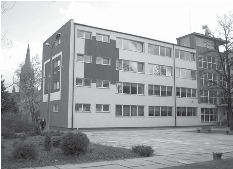
Šobrīd Kuldīgas Centra vidusskolā mācās 670 skolēnu un strādā 54 pedagoģiskie darbinieki.