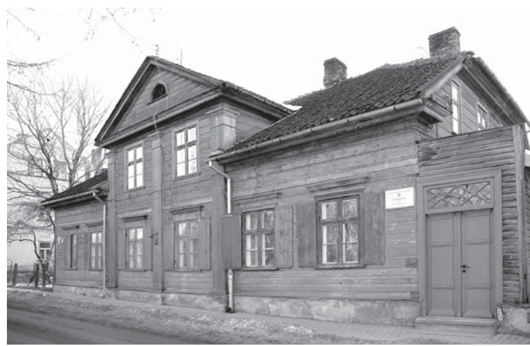
Koka nams Kuldīgā, 1905. gada ielā 12.

Nams 19. – 20. gadsimta mijā piederējis Padures muižas īpaš-