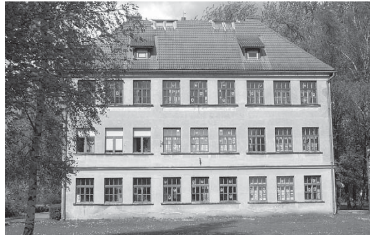
Skola ir bagāta daudzām un interesantām tradīcijām, piemēram, skolas spēkavīru sacensības, Ziemassvētki pie jūras 1. – 4. klašu skolēniem, Emīlijas dienas nepieradinātās modes skate.

daudzi mākslas skolas absolventi, kuri gan veidojuši sienu gleznojumus, gan atstājuši savus diplomdarbus.