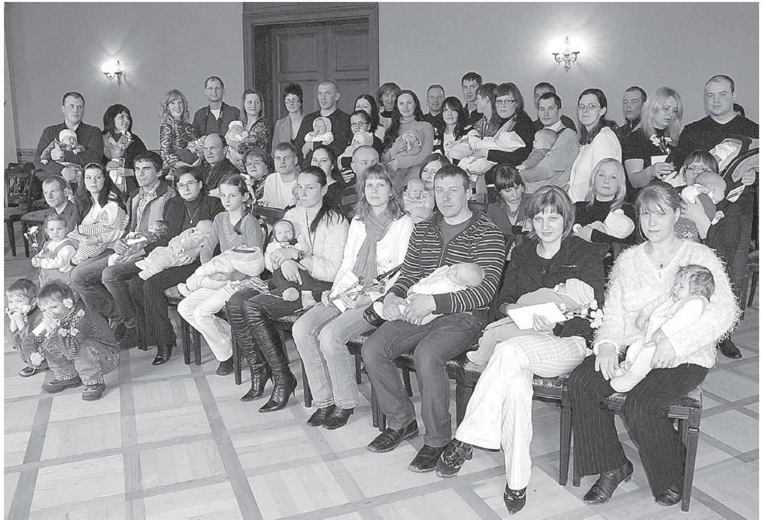
Vecāki ar saviem mazuliem tradicionāli vienojas kopīgai fotogrāfijai.

Kuldīgas novada Domē 14. martā svinīgi tika sveikti vecāki, kuru mazuliši reģistrēti Kuldīgas novada Dzimtsarakstu nodaļā no šī gada 1. janvāra līdz 28. februārim.