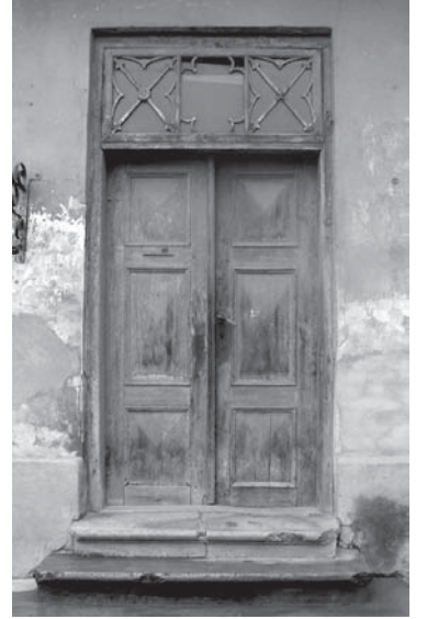
Mucenieku ielas 1 mājas ārdurvis datējamas ar 19. gadsimta vidu.

Jāpiebilst, ka Kuldīgas durvju glābšanas programma tiek īstenota kopš 2008. gada. Ar Valsts kultūrkapitāla fonda, Ziemeļu kultūras fonda, Kuldīgas novada pašvaldības un pašu iedzīvotāju atbalstu šo gadu laikā restaurēti 11 vēsturiskie durvju komplekti, izmantojot korektas restaurācijas metodes.