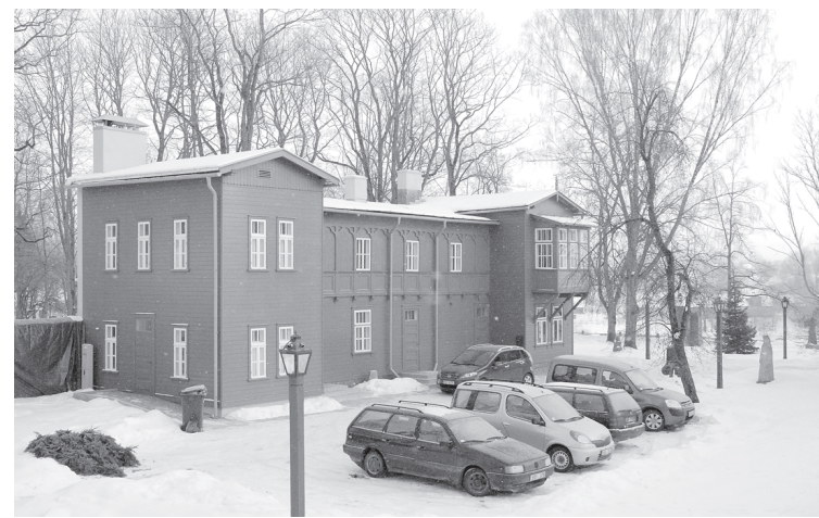
Jaunizveidotais centrs atrodas iepretim Kuldīgas novada muzejam, Pils ielā 5, un ir viegli atrodams. Tas pieejams arī cilvēkiem ar kustību traucējumiem.

Iedzīvotāji, kuru īpašumā ir senlaicīgas mēbeles bojātā stāvoklī un nav vairs vajadzīgas, aicināti piedāvāt tās centram.