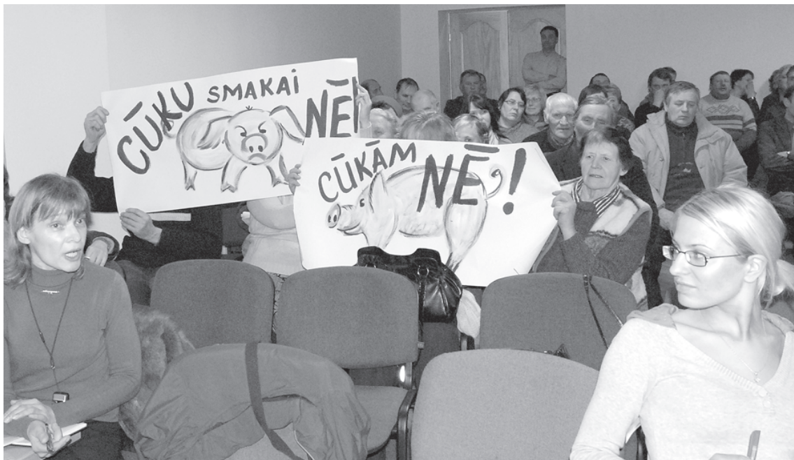
Cūkkūts kompleksa pretinieki bija ne tikai sagatavojuši savu prezentāciju un trīslitru burku piepildījuši ar cūku mēsliem, ko rotāja uzraksts „Šanel Pig54 000 Nasing spešel”, bet arī sarūpējuši plakātus, kas skaidri liecināja par viņu attieksmi pret šo ieceri.

Kūtsmēslu iestrāde augsnē notiks pēc iespējas īsā laikā. Lai neizplāfītos smaka, cūku novietnes plānots izbūvēt, ievērojot jaunākās tehnoloģijas un izmantojot mūsdienīgu ventilācijas sistēmu. Mēslus apsaimniekos un uzglabās slēgtā sistēmā, kas ierobežos nevēlamo smaku noplūdi. Mēslu krātuves pamatne un sānu daļas tiks pārklātas ar necaurīdīgu, pret agresīvu vidi noturīgu ģeomembrānu. Lielākais smaku izplatīšanās risks var būt tad, kad kūtsmēsli izved uz lauka.